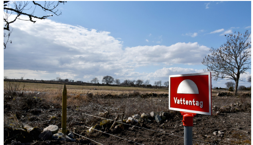
Utredningen har uppskattat att över 1200 täkter i dag saknar rätt skydd.

I praktiken är arbetet redan i gång över hela landet och frågan är hur man ska få till regelverk som tillåter både produktion av mat och bra dricksvatten. Det är gigantiska arealer som kan komma att lyda under lokala vattenskyddsföreskrifter och i en del av dessa områden blir det omfattande administration eller rena förbud.