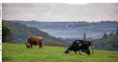
Under hösten anordnas läsaresor till Irland och Zambia med Land Lantbruk.