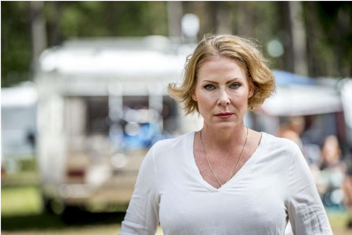
Riksdagsledamot Marlène Lund Kopparklint (M)